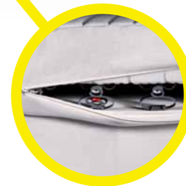
...und so sieht die Zukunft aus: Lattoflex 800

Ein Lattoflex 800 Bettsystem sieht wie eine herkömmliche Matratze aus. Der Unterschied steckt im Inneren: Öffnen Sie den Reißverschluss und werfen Sie einen Blick auf die High-Tech Federung.